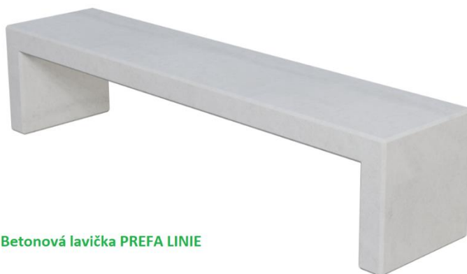
Betonová lavička PREFA LINIE