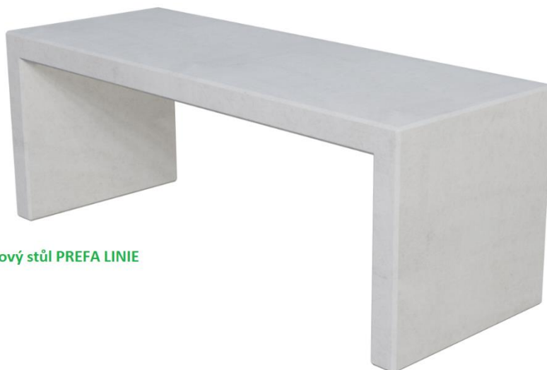
Betonový stůl PREFA LINIE

Betonová sestava Prefa Linie se skládá z lavice a stolu, jsou to průmyslově vyráběné výrobky z prostého betonu. Základem použitého betonu je cementová matrice, plnivo (kamenivo) a voda. Dále jsou obsaženy modifikační přísady pro zlepšení vlastností betonu.